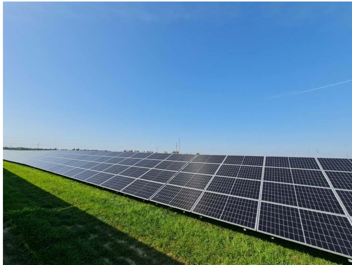
FOTOFIKSACIJA - 1