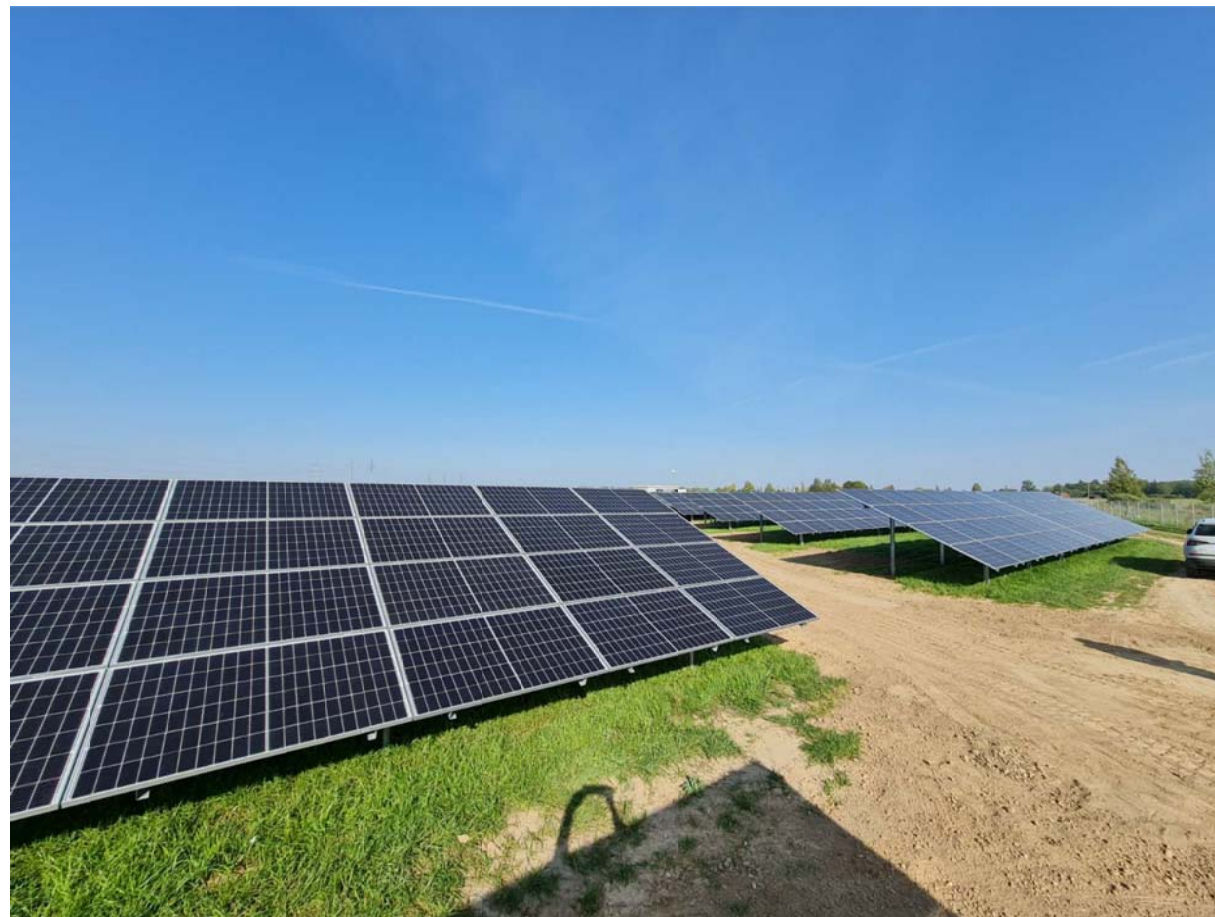
FOTOFIKSACIJA - 2.