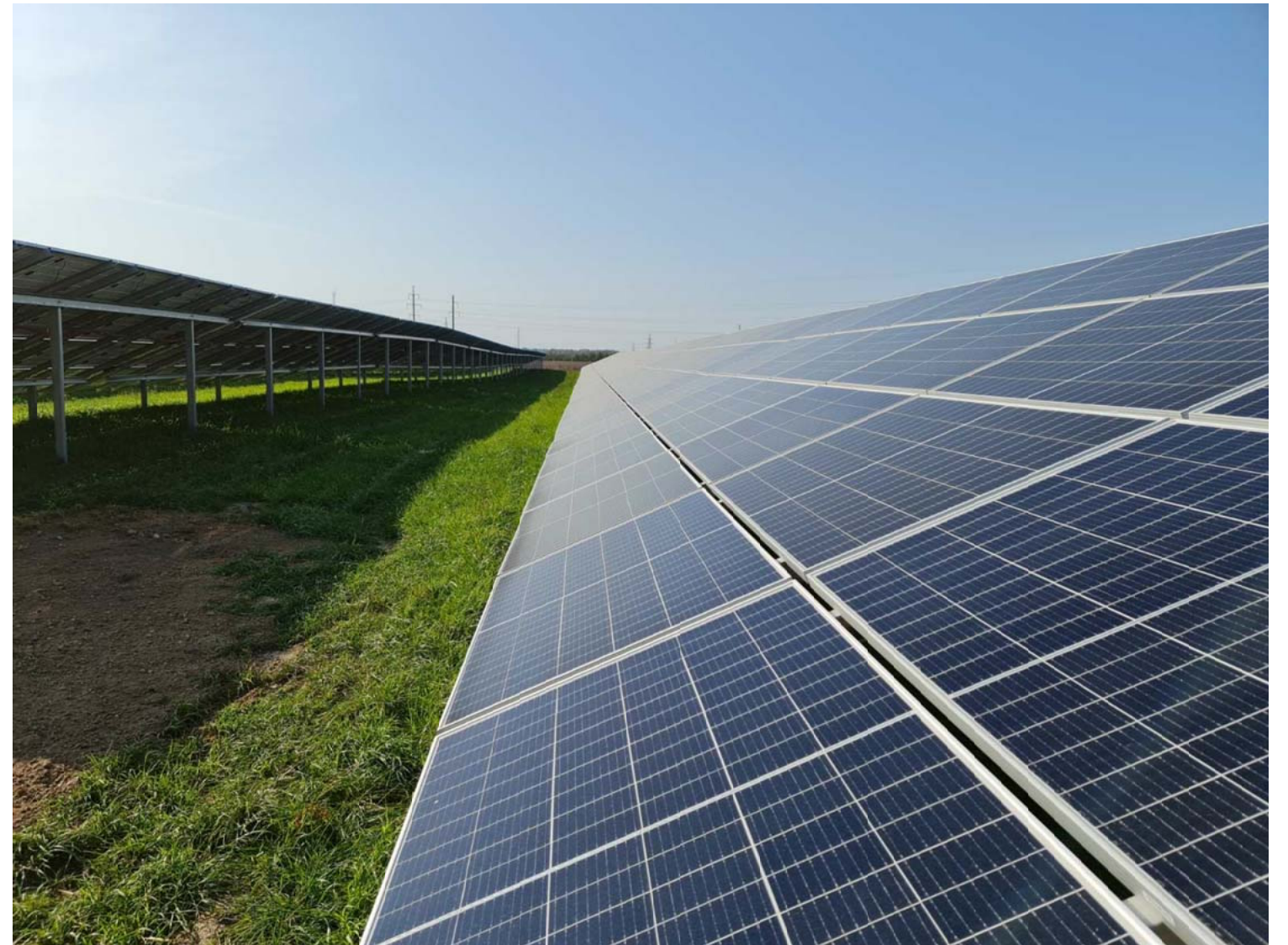
FOTOFIKSACIJA - 3.