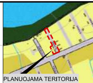
PLANUOJAMA TERITORIJA SITUACIJOS SCHEMA KAIŠIADORIŲ M. TERIT. BP SPRENDINIUIŠE