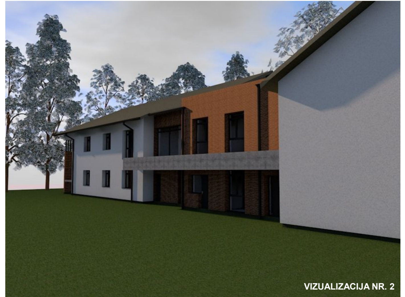
VIZUALIZACIJA NR. 2