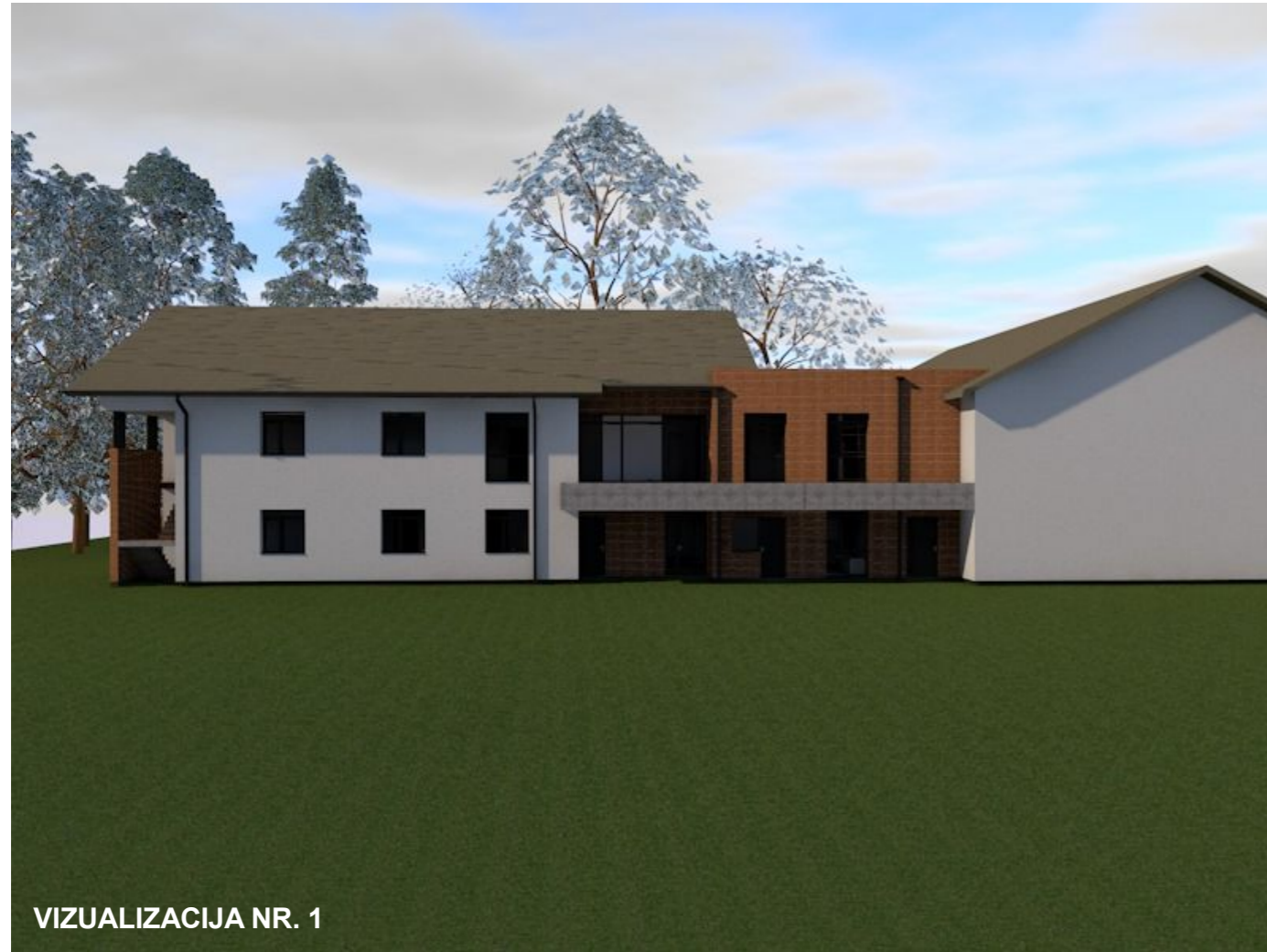
VIZUALIZACIJA NR. 1